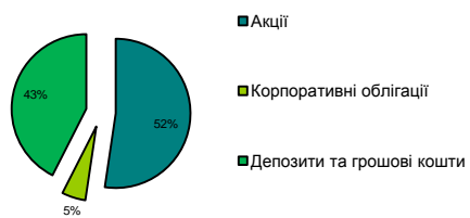
Портфель акцій за секторами