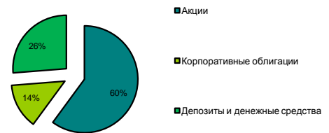
Портфель по классам активов