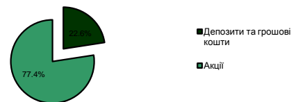
Портфель за секторами