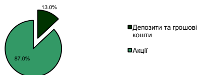
Портфель за секторами